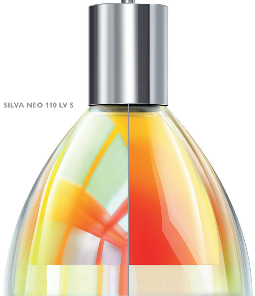
SILVA NEO 110 LV S